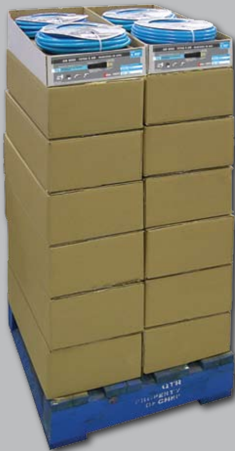
HARP1450QP 56 x HARP1450