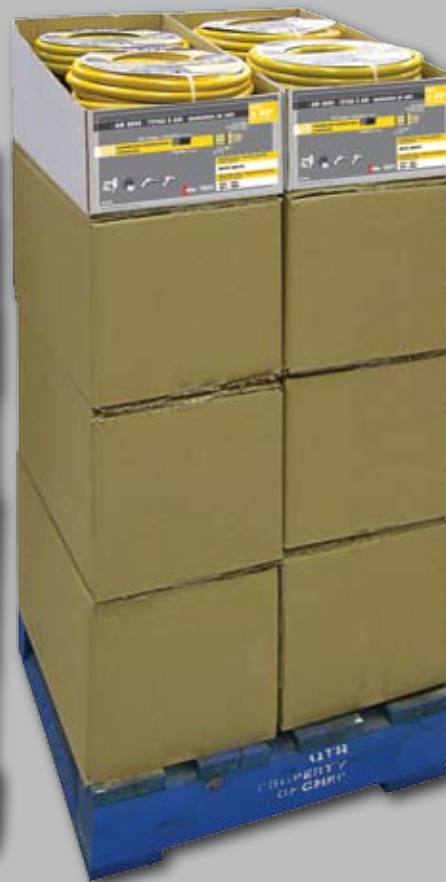
HAC3850QP 32 x HAC3850